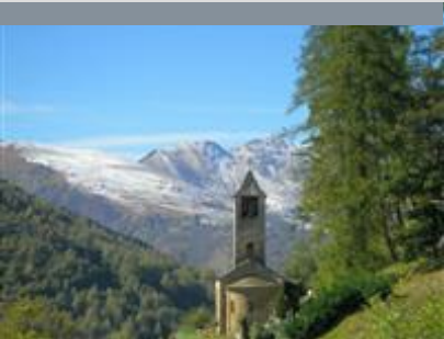
POINT DE VUE AU VILLAGE